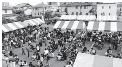
↑ボラフェスタ2025の様子