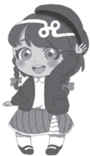
イメージキャラクター あずかちゃん