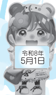
イメージキャラクター ぎょうちゃん