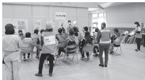
昨年の訓練の様子

今年度は商工会の協力により市内企業と連携して災害ボランティアセンター設置時において人材や物資などの提供をお願いするための協定を結びます。また、高校生を中心とした学生ボランティアを育成するため訓練への参加を呼びかけていきます。