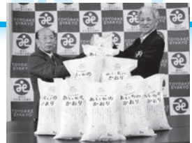
JAあいち尾東豊明支店様よりお米40kgのご寄付をいただきました。