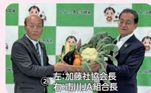
左:加藤社協会長 右:市川JA組合長