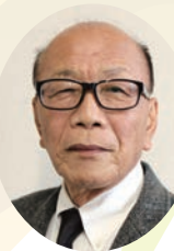
豊明市社会福祉協議会

皆様には、輝かしい新春をお迎えのことと心からお喜び申し上げます。 旧年中は、豊明市社会福祉協議会に對しまして、格別のご支援とご協力を賜り厚くお礼を申し上げます。 さて、昨年度、豊明市第3次地域福祉計画および第5次地域福祉活動計画を市とともに作成いたしました。 本計画では、誰かとつながり合いながら、孤立せずにその人らしく生きる地域共生社会を実現するため「誰もが誰かとつながりあえるまち」とよあけ」を基本理念として掲げています。 重点施策である、包括的支援体制の充実・強化のため、昨年度より引き続き重層支援センターおよび自立生活相談センター「よりそい」へ職員を派遣しています。複合的課題を抱えた方を制度の狭間に取り残すことなく、包括的支援を実現するためには、行政、専門機関、地域住民の方々が互いに情報を共有し、信頼を築くことが不可欠です。 そして、基本理念に基づき、「あいさつ運動」を継続して展開していきます。 日常的な「交流」を大切に、コミュニケーションを基盤とした福祉を地域に根付かせていきたいと考えています。 本年も豊明市の地域福祉向上のために役職員一同さらなる鋭意、努力をまいりますので、皆様の一層のご支援とご協力をお願いするとともに、皆様のご健勝とご多幸を心からご祈念申し上げまして、新年のごあいさついたします。