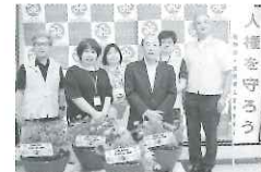
「人権の花運動」贈呈式、三崎小学校の 生徒によって育てられた花が贈呈されました。