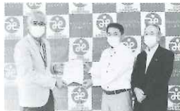
連合愛知尾張東地域協議会より 非接触型体温計2台の寄付