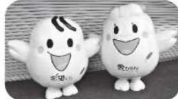
赤い羽根共同募金のシンボルキャラクター "愛ちゃん"と"希望くん"