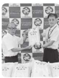
JA豊明支店様よりお米5kgを30袋ご寄付いただきました。