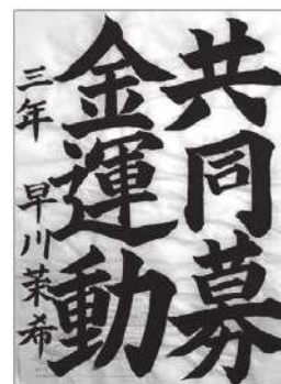
昨年の市長賞作品 書道の部門 早川 菜希様