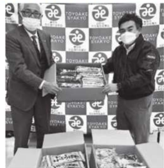
フジパン株式会社 豊明工場様より菓子パンを寄付いただきました。