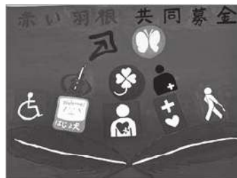
昨年の市長賞作品 ポスター部門 城田 健太郎様