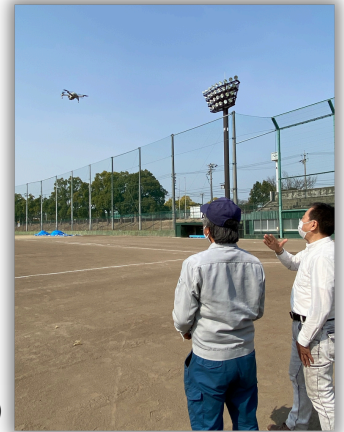
市民福祉講座 (レッツライドローン講座の様子)