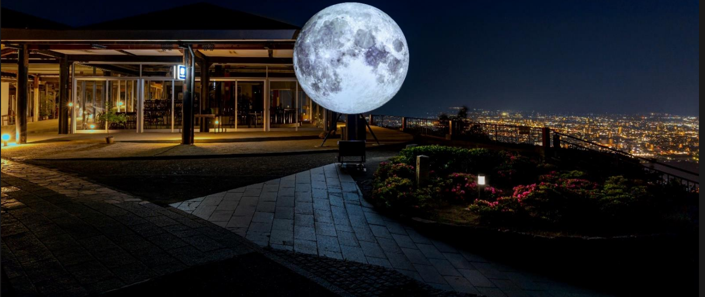
渡辺 篤(アイムヒア プロジェクト)《月はまた昇る》2022年 「瀬戸内国際芸術祭2022」にて