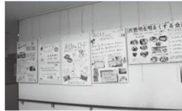
▲2019年 ポラフェスタの様子