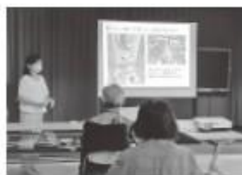
▲セミナーの様子 (みなさん熱心に聞いていました!)