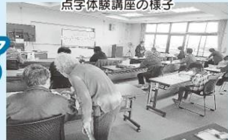
点字体験講座の様子

ボランティアセンターでは、ボランティアの育成や団体の活動支援を行っています。ボランティアフェスティバルや災害ボランティアセンターの運営訓練も行っています。