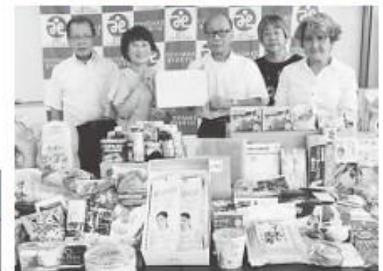
▲8月3日豊明市商工会からの寄付の様子

令和4年7月1日から 令和4年8月31日までの ご寄付を掲載しております。 (敬称略)