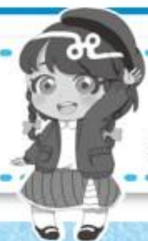
イメージキャラクター あすかちゃん

私は今年も食欲の秋になりそうです。 舞茸ご飯・栗ご飯と、今年こそは奮発して松茸ご飯を食べたいです。(A)