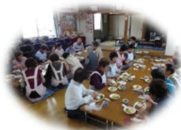
地域サロンの様子(館なかよし会)

豊明社協では、地域の皆さまからの会費や寄付金、市等からの補助金・受託金により様々な事業に取り組んでいます。